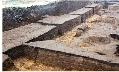
昨年度調査した建物跡の基礎の様子（今回の調査でも同建物の一部が確認されました。）